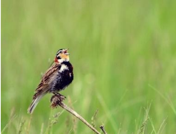
Fotografía: Macho ( Rick Bohn, USFWS/Flickr )

Los escribanos collar castaño miden 4.5-6 en/11-15 cm de largo. Son una de las aves más coloridas de la pradera de pasto corto; los machos tienen el vientre negro, la garganta amarillenta y la nuca oxidada. Las hembras y las aves no reproductoras son menos llamativas, en su mayoría de color marrón grisáceo pálido en la parte superior con rayas borrosas en el pecho. La cola es distintiva en todas las aves, en su mayoría blanca con un triángulo negro en el centro.